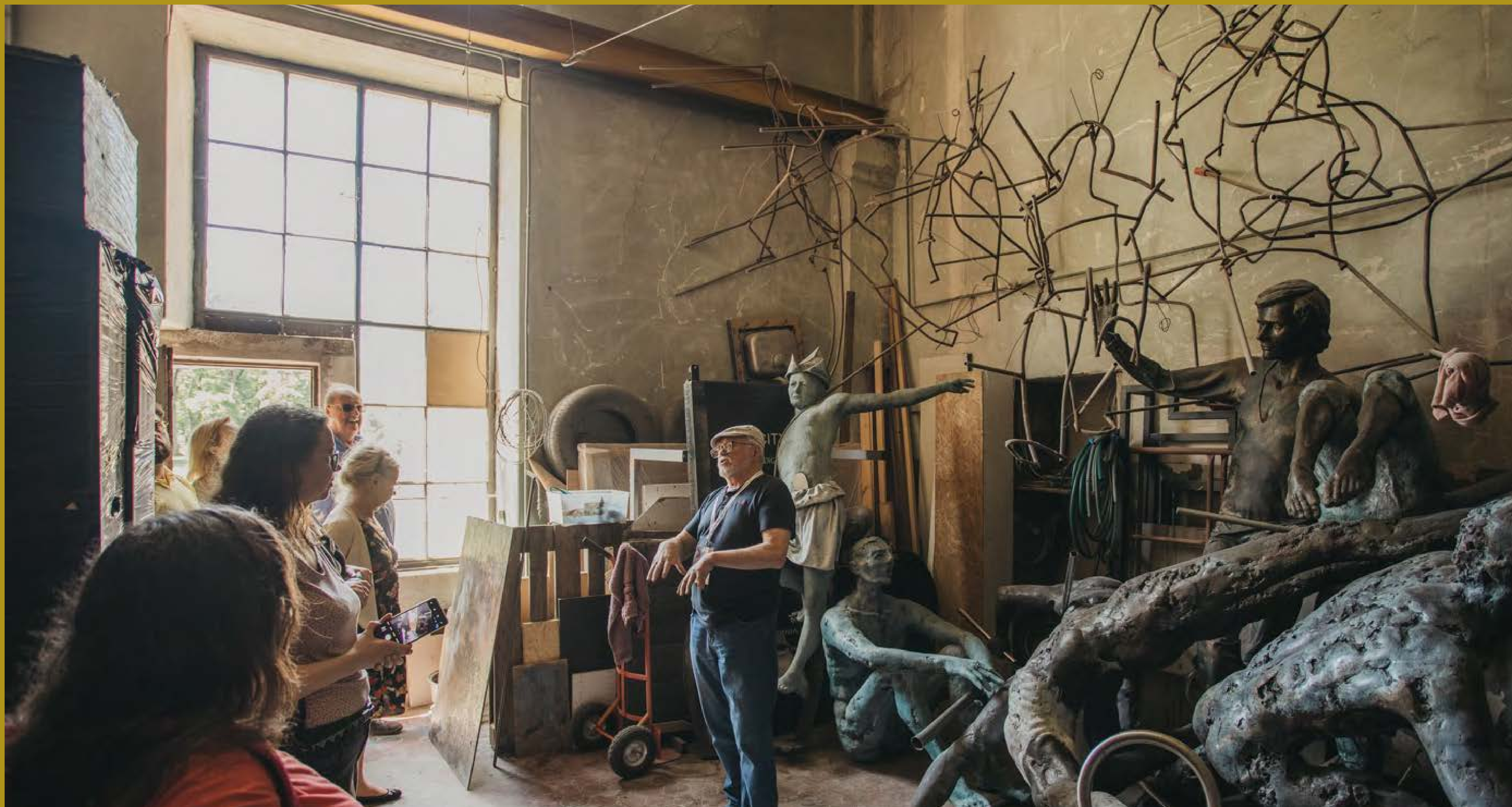
Uczestnicy 26. MDDK podczas wizyty w pracowni rzeźbiarza Jerzego Jotki-Kędziory w Kobierzynie, fot. D. Ścigalski, Współczesna Sztuka Dokumentacji, 2024