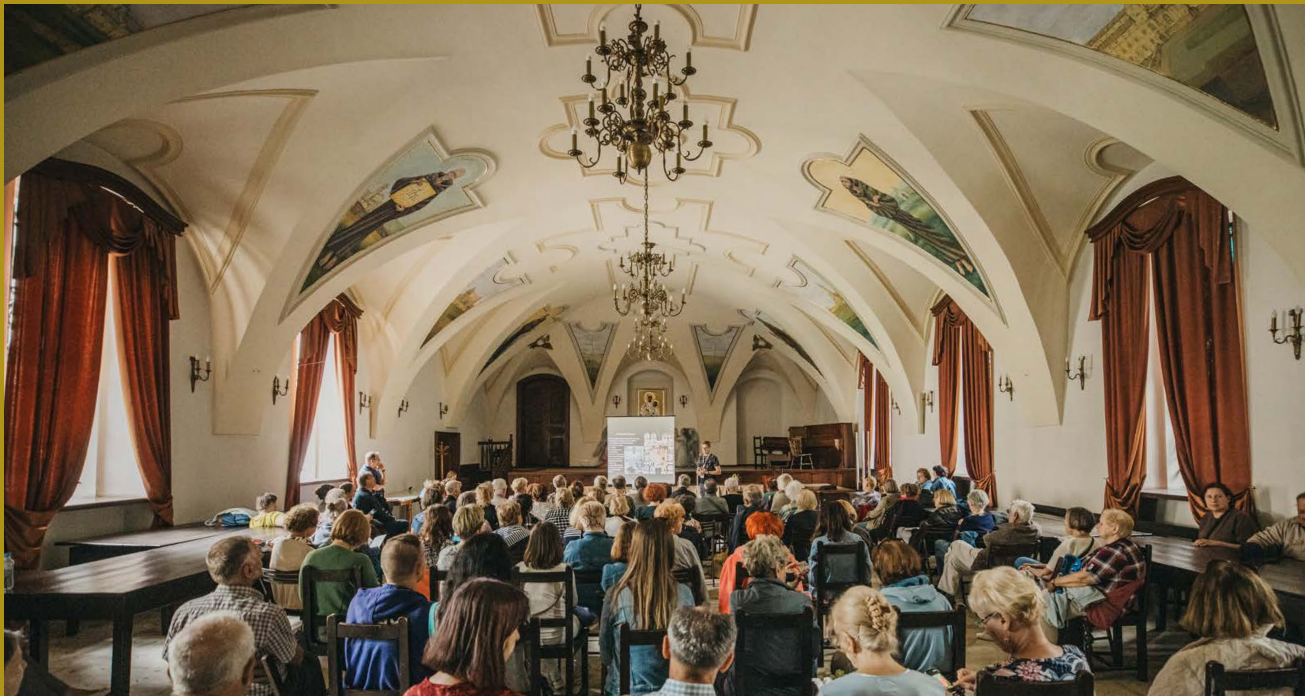
Wykład historyka sztuki Michała Kurzeja u oo. Bernardynów w Krakowie, fot. M. Saltarski, Współczesna Sztuka Dokumentacji, 2024