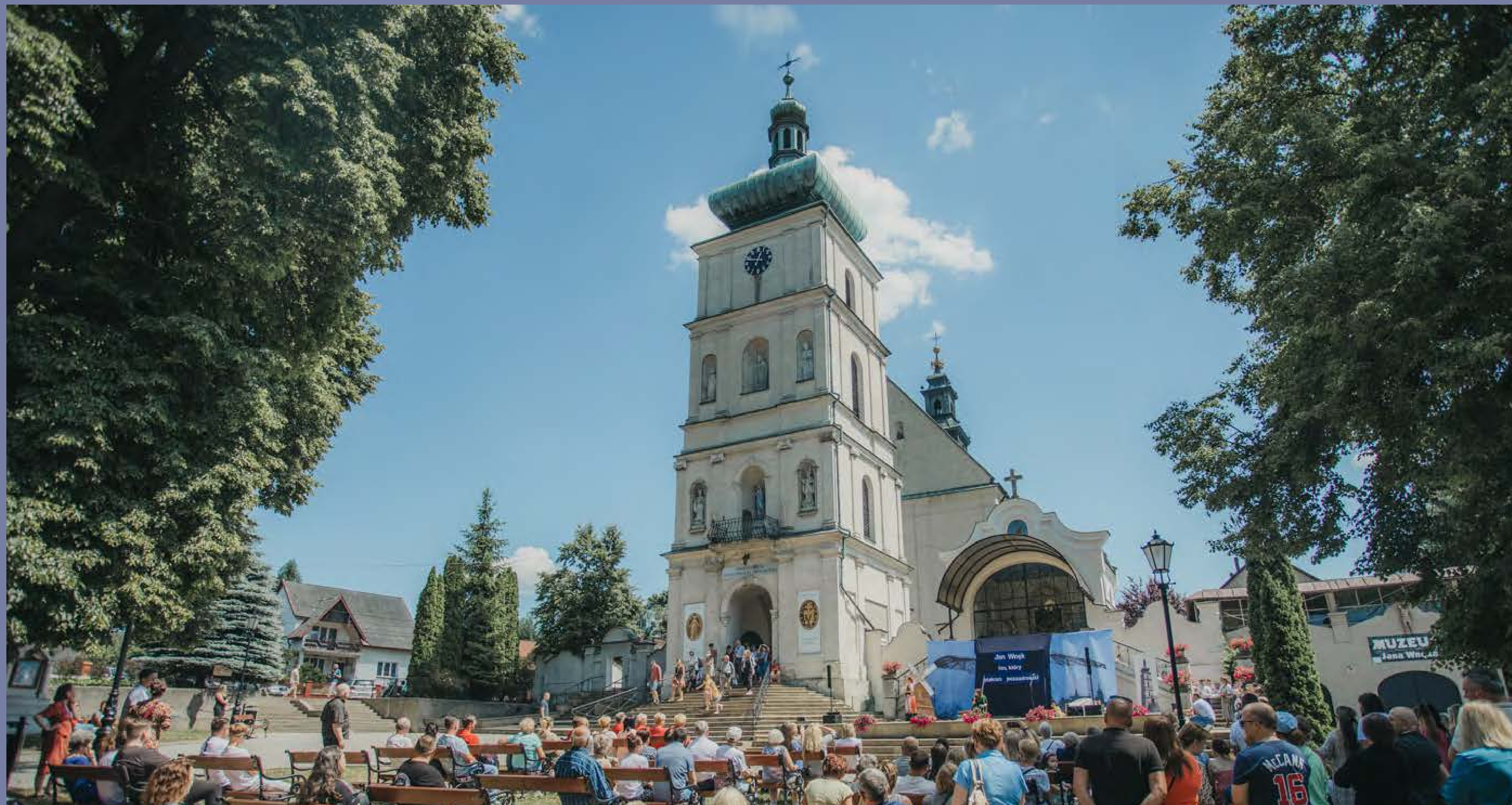
Publiczność na przedstawieniu o życiu Jana Wnęka, pod kościołem w Odporszowie, fot. D. Ścigalski, Współczesna Sztuka Dokumentacji, 2024