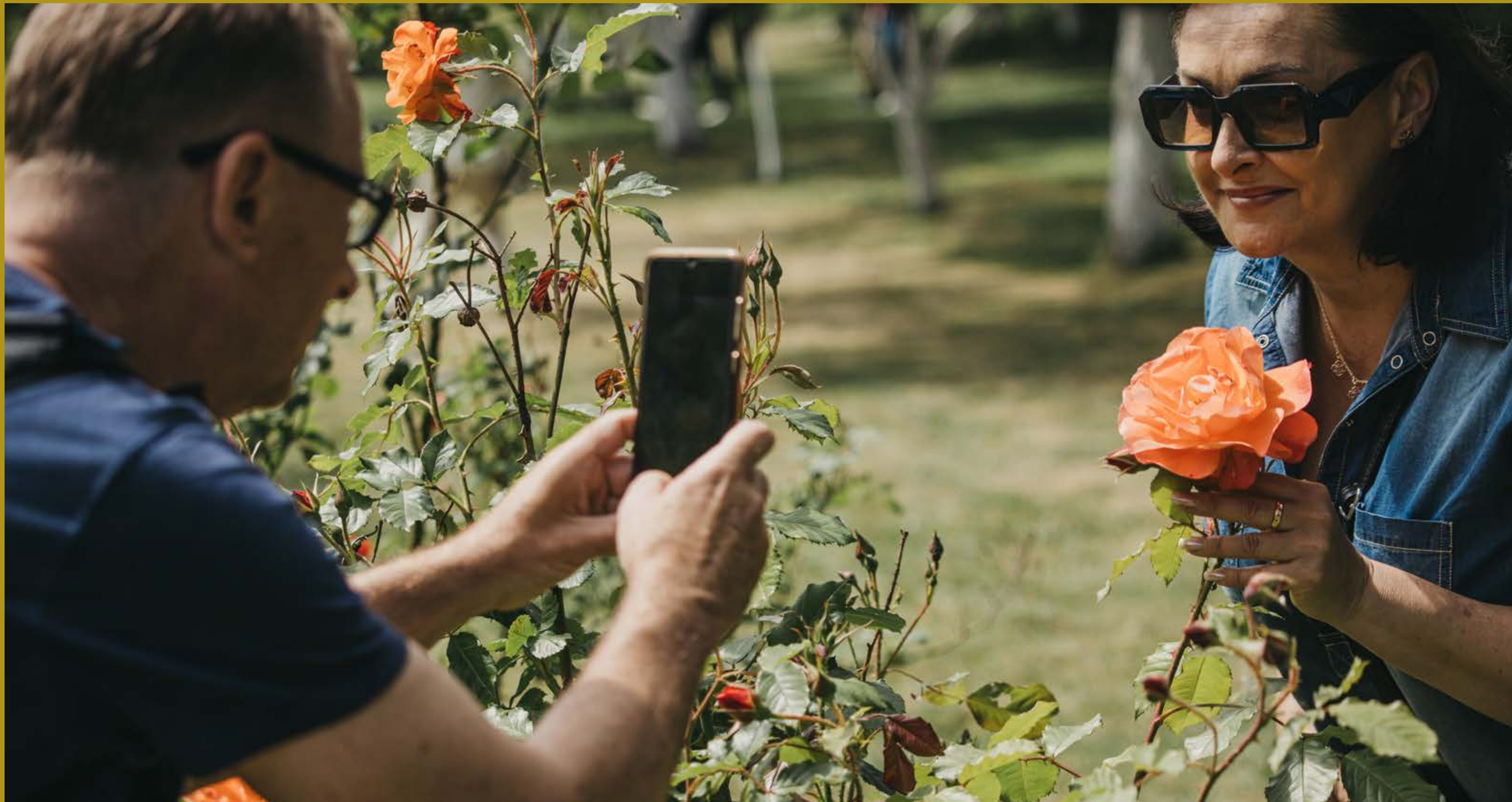
Uczestnicy Dni Dziedzictwa w ogrodzie oo. Bernardynów w Krakowie, fot. M. Saltarski, Współczesna Sztuka Dokumentacji, 2024