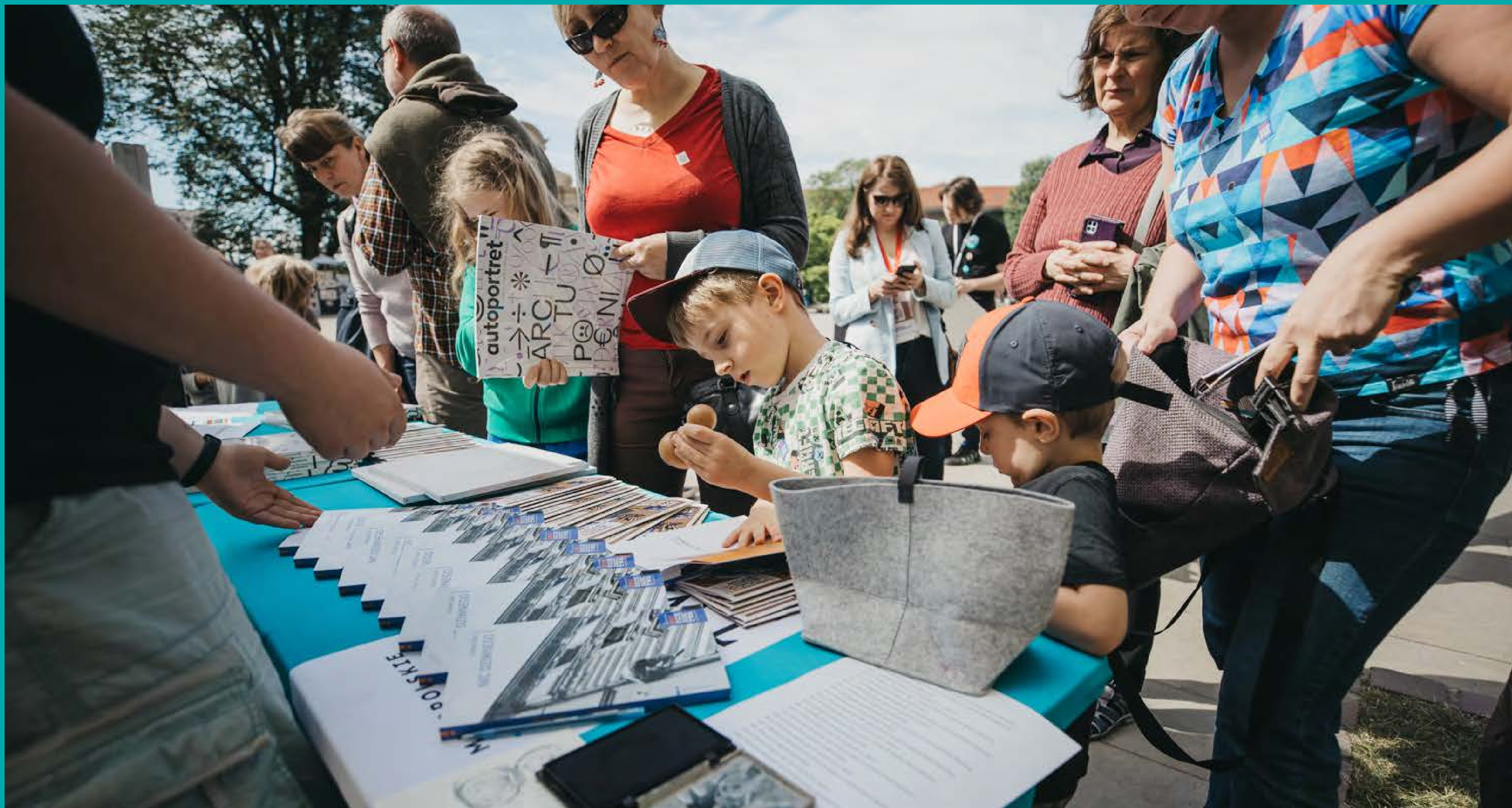
Uczestnicy 26. MDDK przed punktem informacyjnym budynku nr 5 na Wawelu, fot. M. Saltarski, Współczesna Sztuka Dokumentacji, 2024