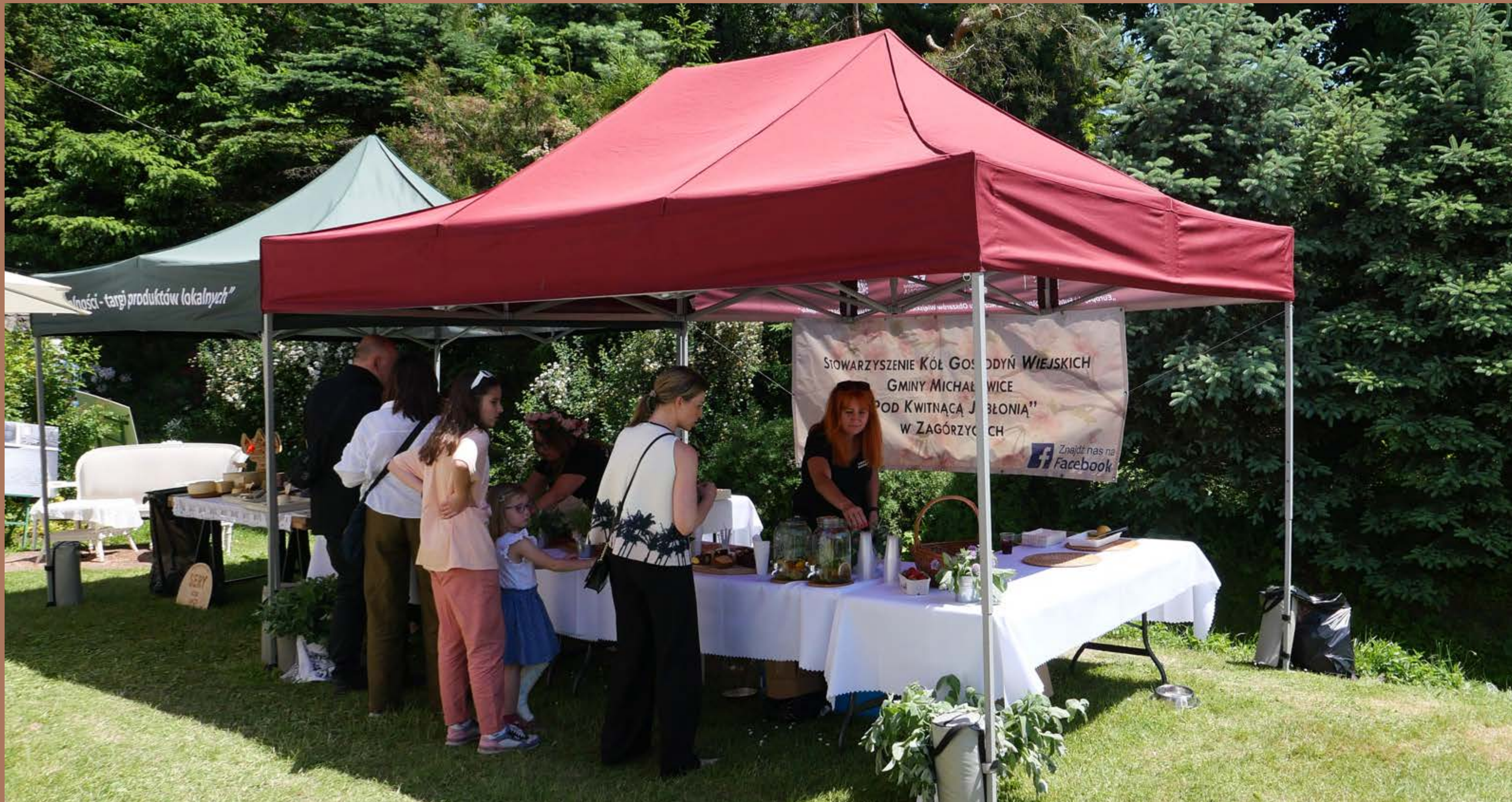
Koła lokalnych gospodyń zaangażowane w sprzedaż smakołyków, fot. M. Chlanda, 2024