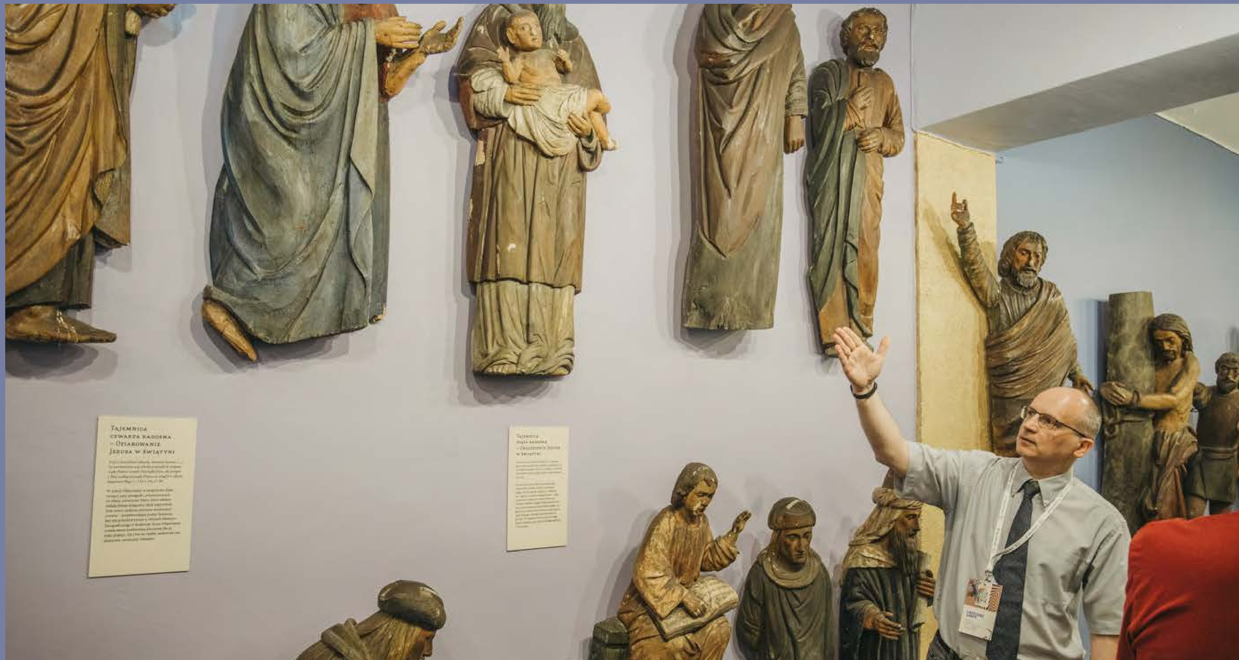
Opowieść etnografa Grzegorza Graffa o rzeźbach Jana Wnęka, w Muzeum Jana Wnęka w Odporyszowie, fot. D. Ścigalski, Współczesna Sztuka Dokumentacji, 2024