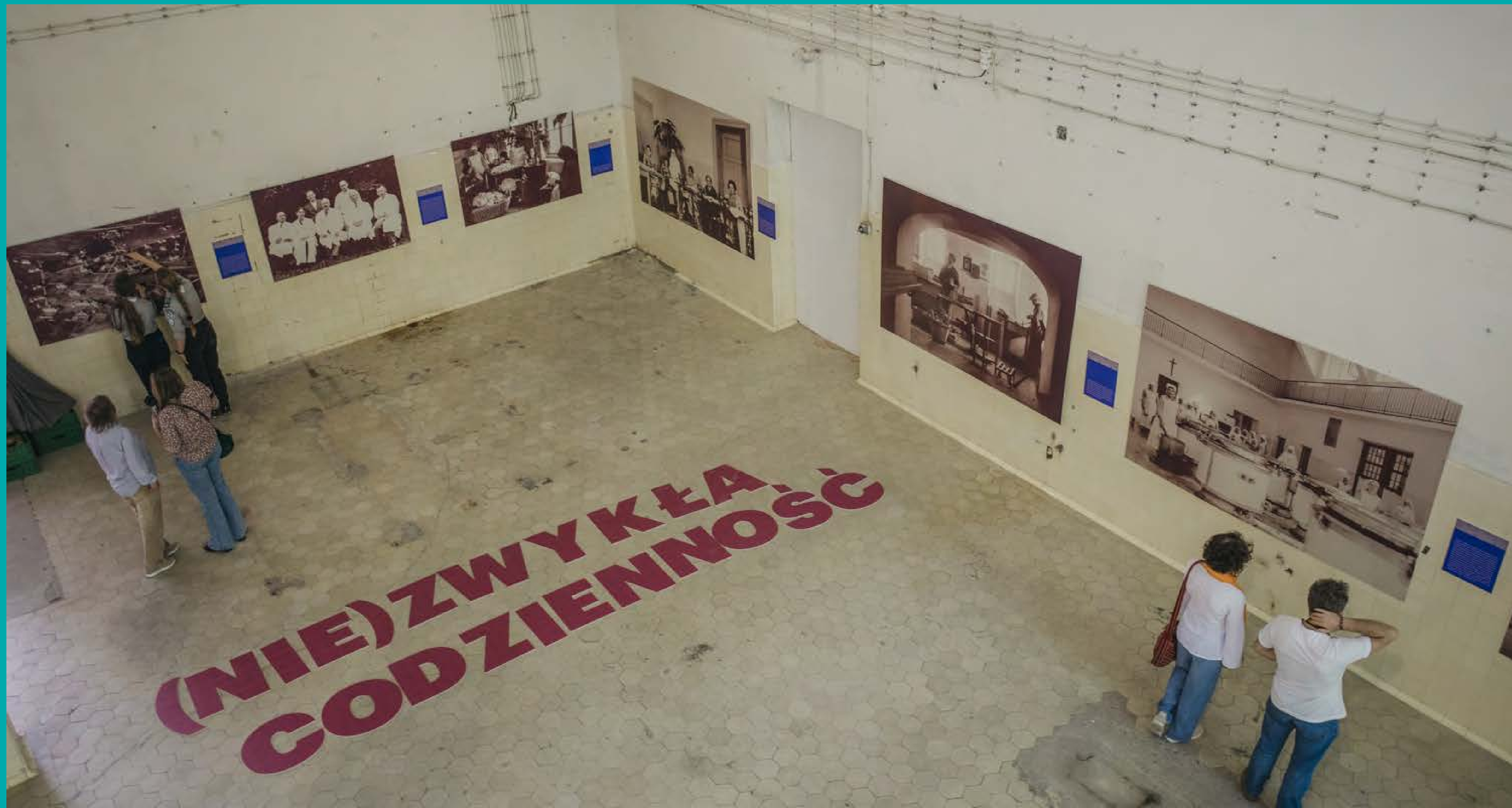
Wystawa (Nie)zwykła codzienność w dawnej pralni w Kobierzynie, fot. D. Ścigalski, Współczesna Sztuka Dokumentacji, 2024