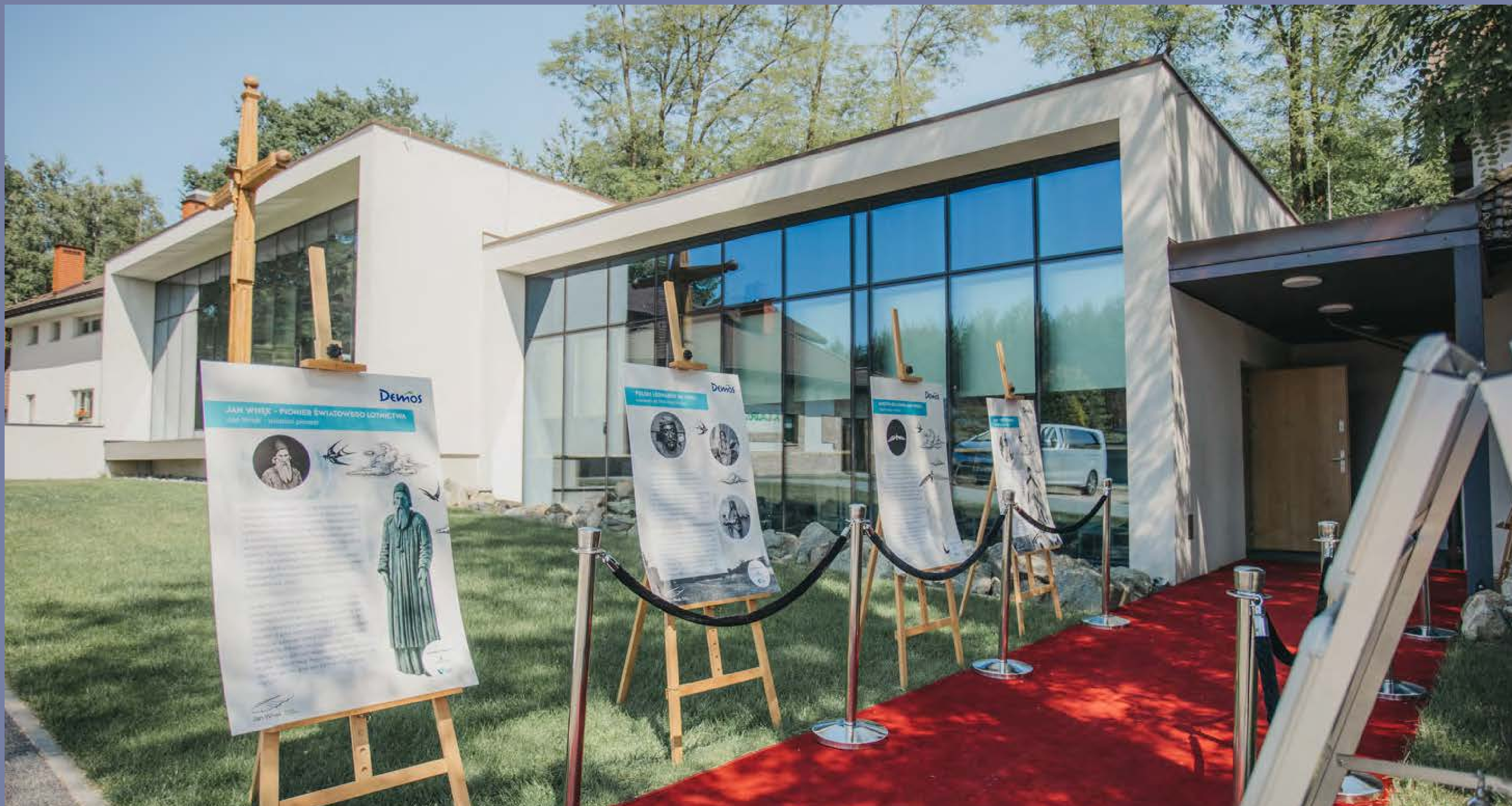
Wystawa poświęcona Janowi Wnękowi przy wejściu na salę kinową Siemacha SPOT w Odporyszowie, fot. D. Ścigalski, Współczesna Sztuka Dokumentacji, 2024