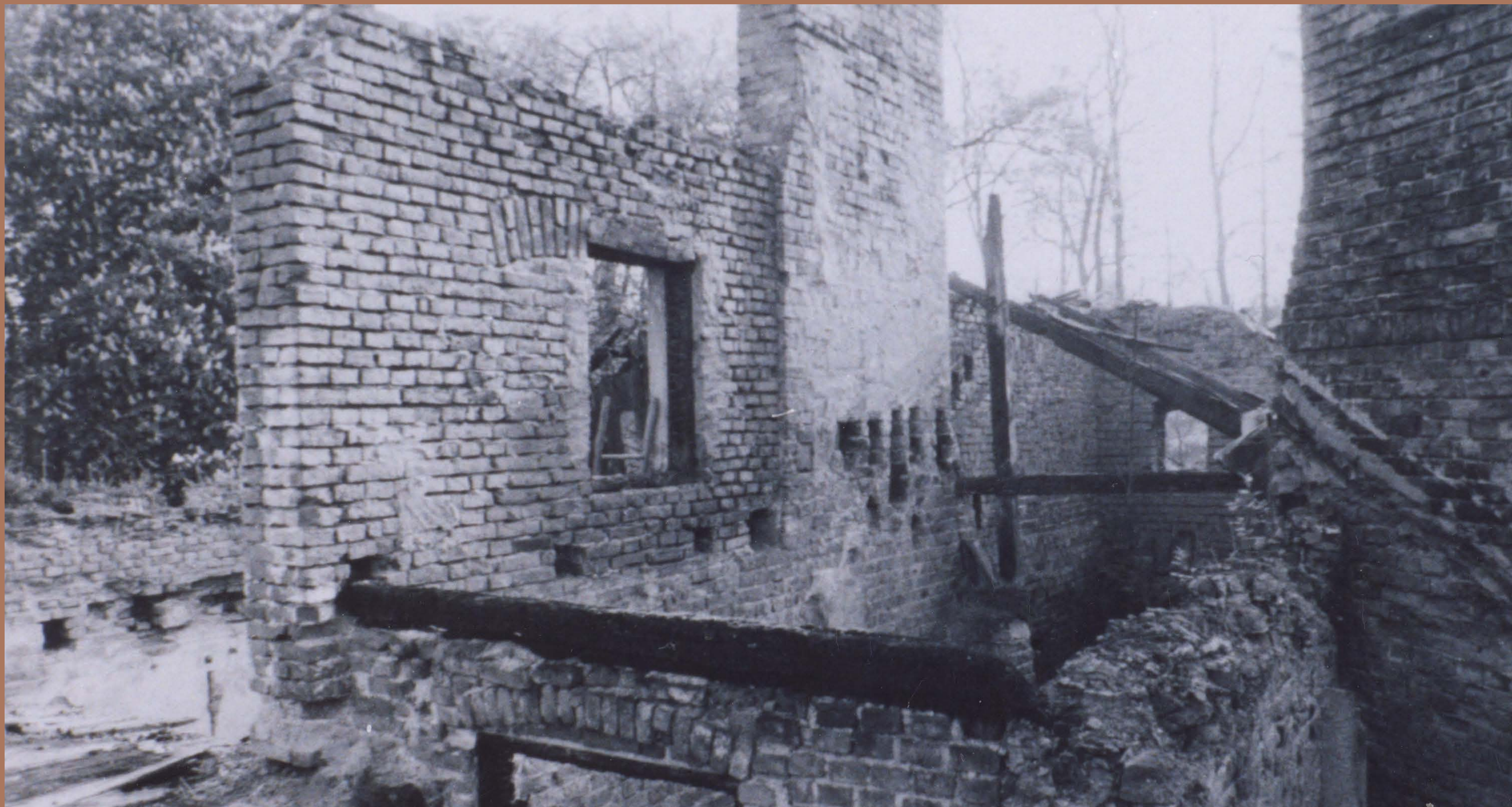
Stan dworu w latach 80. XX w. po zakupie go przez Państwa Lorenzów.