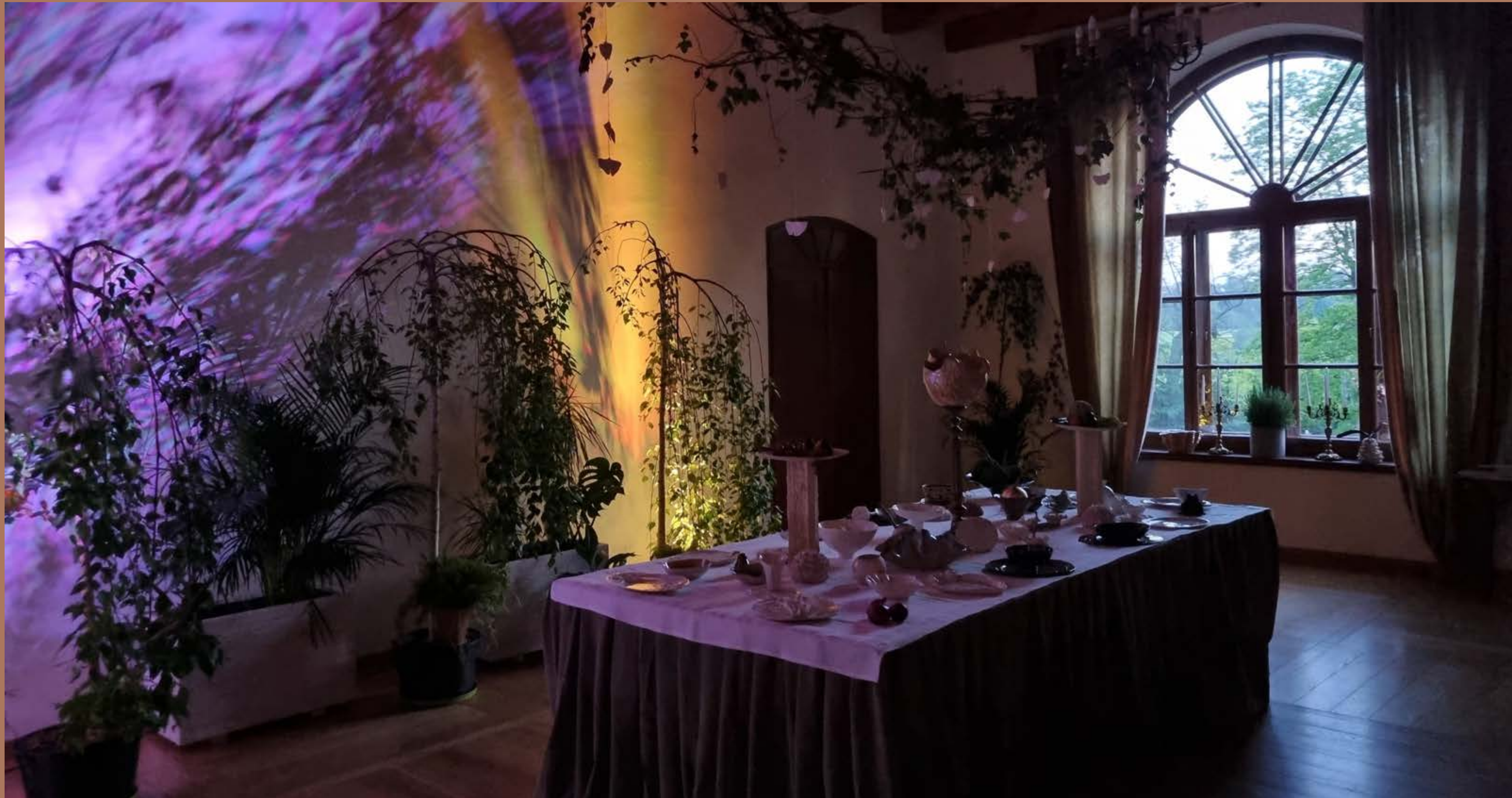
Uczta z designem u mistrza Talowskiego – wystawa zrealizowana przez Iwonę Robotycką i Barbarę Lorenz dla 25. edycji Małopolskich Dni Dziedzictwa Kulturowego